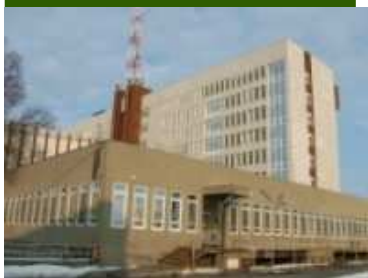
Toldy Ferenc Kórház Cegléd

Mottó: " Uram, az én rögöm magyar rög, Meddő, kisajtoló. Mit akar A te nagy mámor - biztatásod? Mit ér bor - és véráldomás? Mit ér az ember, ha magyar?"